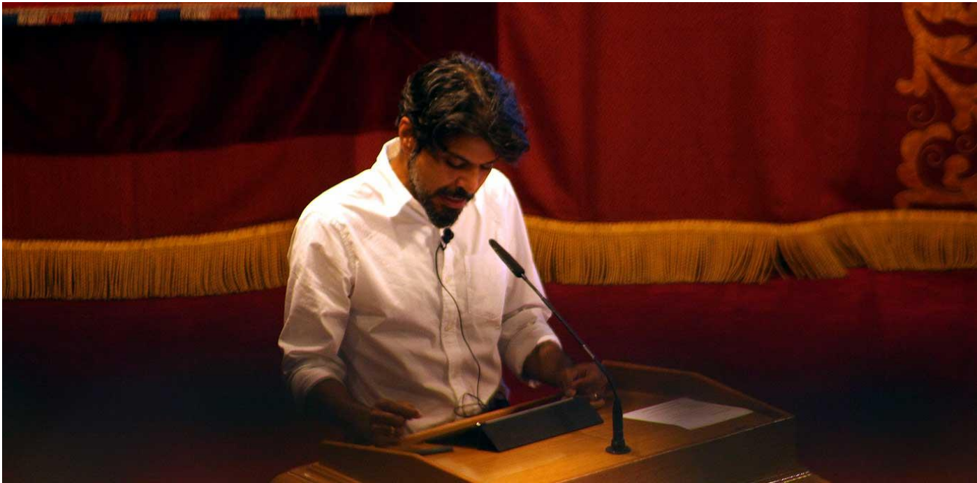
El escritor Pankaj Mishra

Por último, el ponente ha señalado que, si bien podría ser cierto que la Ilustración signifique que el hombre sale de esa autoimpuesta inmadurez, asegura que esta tarea nunca se cumple y debe ser renovada continuamente por cada generación. "Esa es una vez más nuestra tarea y esta vez tenemos que llevarlo a cabo globalmente", ha puntualizado.