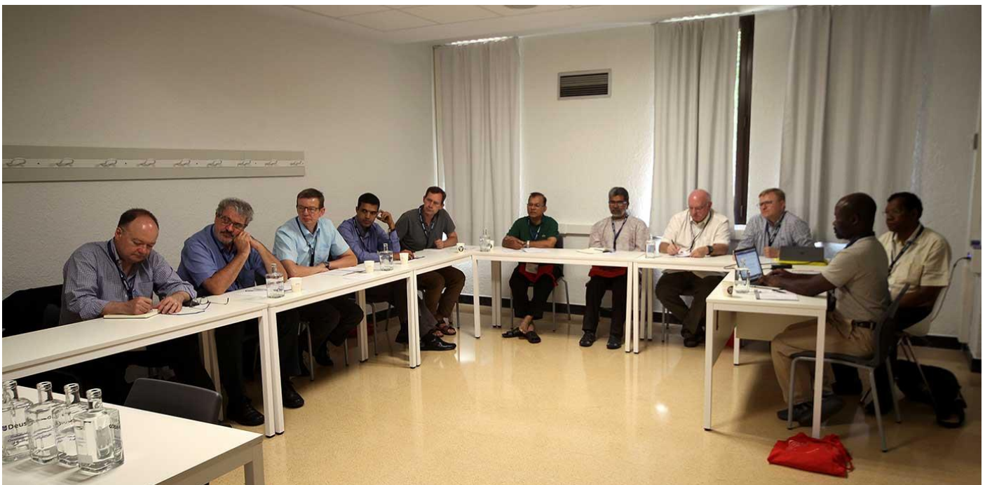
Imagen de una de las sesiones de trabajo en equipo

Los actos de este día han seguido con las sesiones de trabajo en torno a las seis líneas temáticas sobre las que gira la Asamblea: “Formación de liderazgo en la universidad”, “Liderazgo cívico y político”, “La justicia económica y medioambiental”, “Educar a los marginados y a los pobres”, “Diálogo interreligioso, colaboración y entendimiento” y “Paz y reconciliación”.