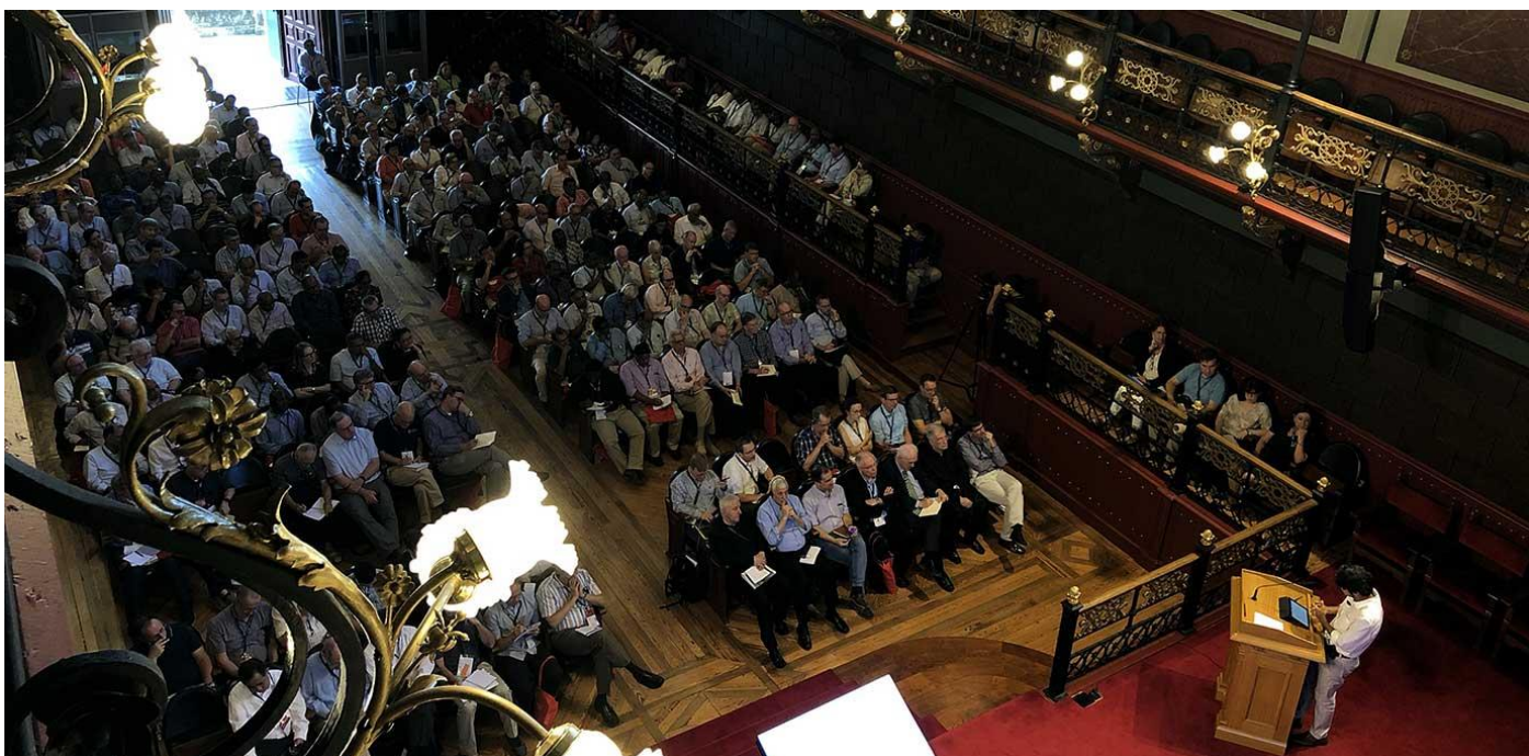
Vista general de la ponencia de Pankaj Mishra

El rey Felipe VI inauguró ayer este Encuentro que reúne a más de 300 rectores y dirigentes de las más de 200 universidades de la Compañía de Jesús del mundo