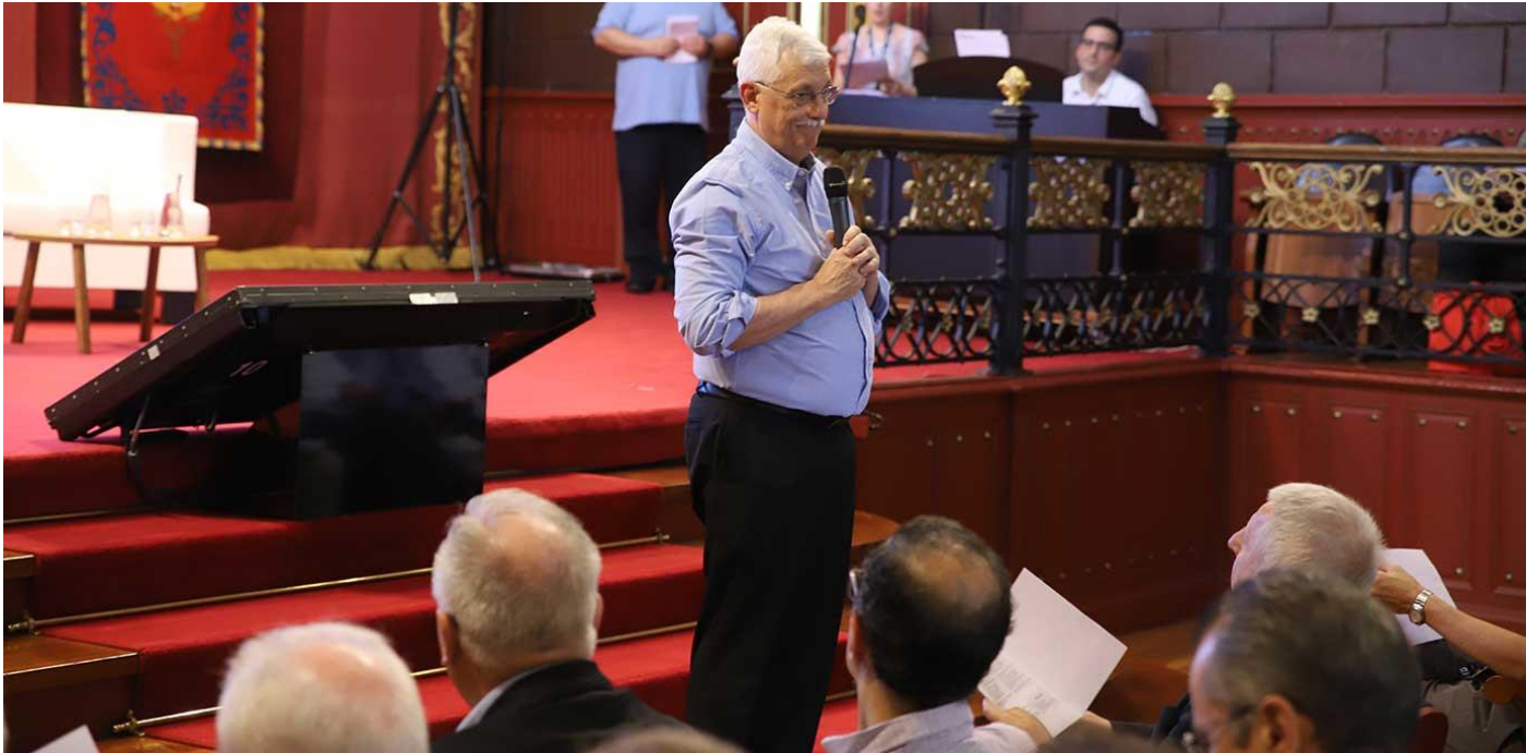
El Padre General Arturo Sosa ha dado la bendición de la oración que ha abierto la sesión de este martes, 10 de julio