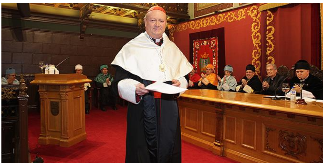
Cardenal Ravasi, cuando fue nombrado doctor honoris causa por la Universidad de Deusto, en 2014